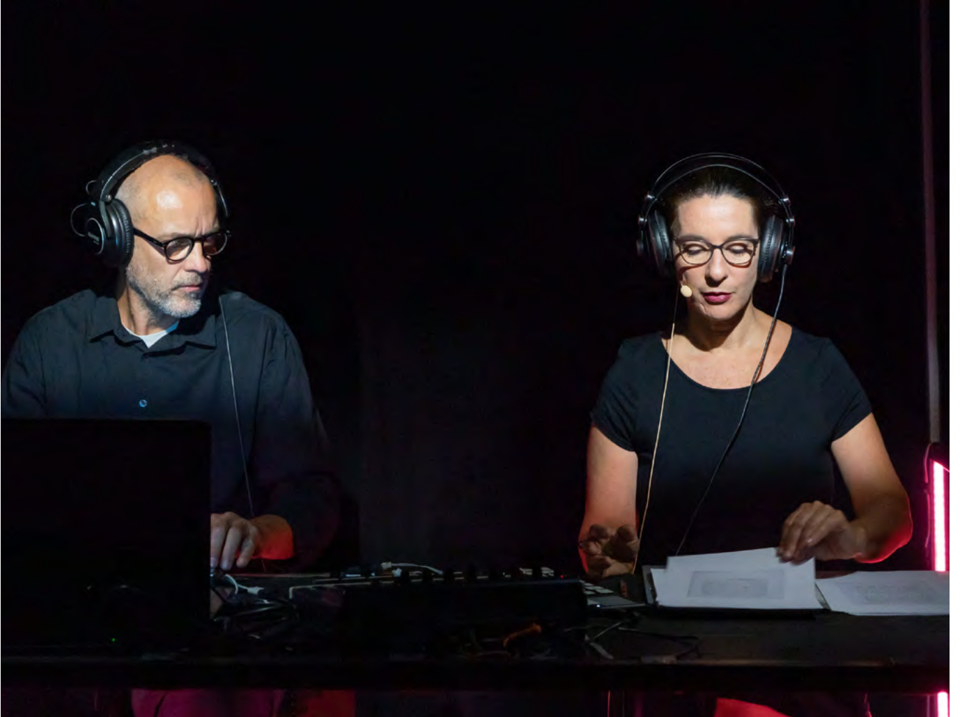
@ Patrick Moll 2021